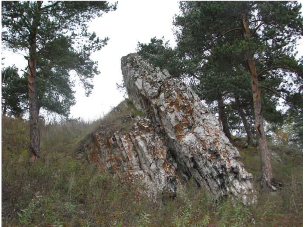
Скалы Собачьи ребра, Урал.