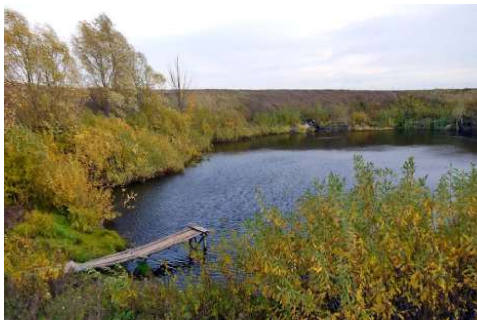
Озера Собакинские Ямы, Татарстан.

Подобные карты были популярны во время Первой мировой войны.